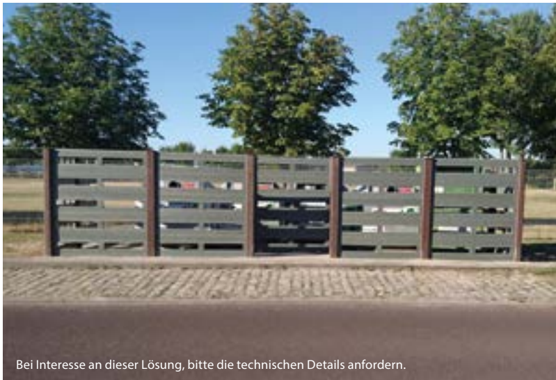
Bei Interesse an dieser Lösung, bitte die technischen Details anfordern.